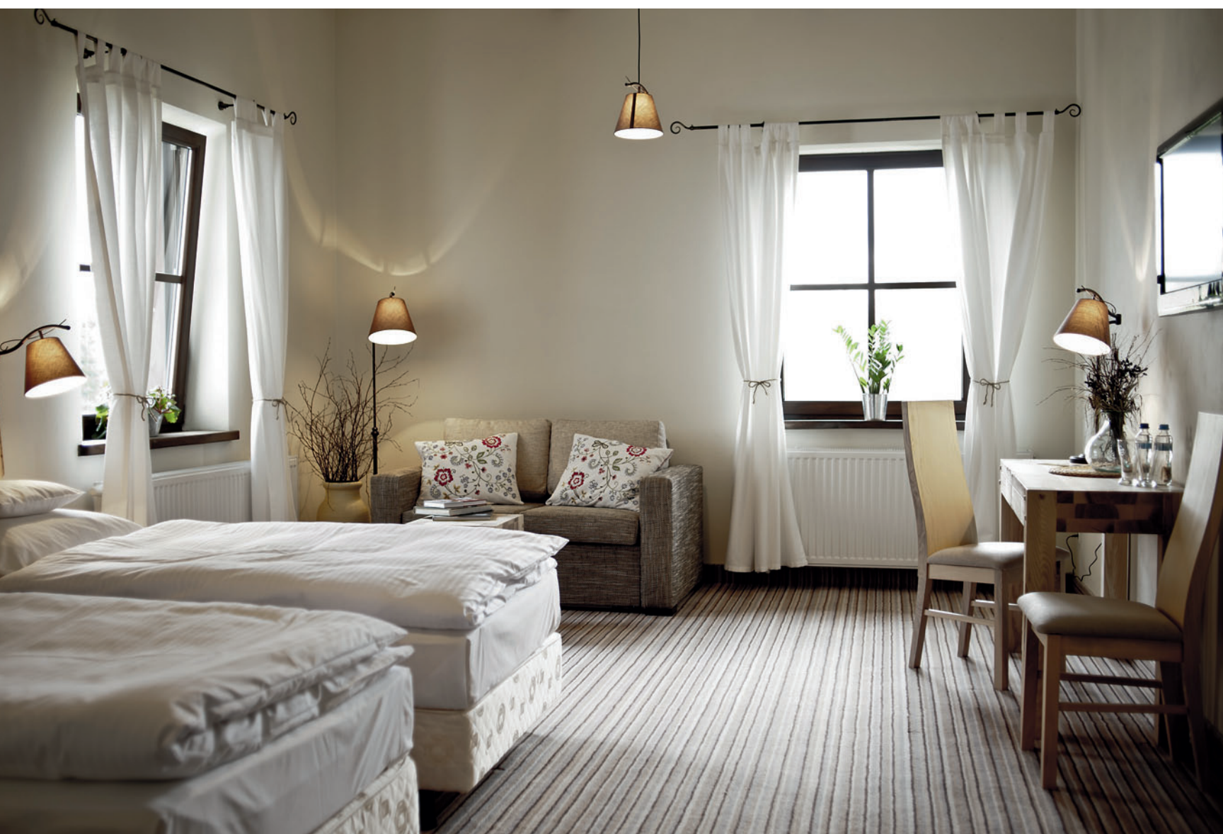
Mazurskie Siedlisko Kruklin ma swój niepowtarzalny styl. Wnętrza są niezwykle przyjazne, utrzymane w naturalnej tonacji.

Wizytówką Hotelu są niewątpliwie kąpiele. Goście mogą spróbować swoich sił pod okiem wykwalifikowanego instruktora lub spędzić miło czas w siodle podziwiając mazurskie krajobrazy. W okresie letnim do dyspozycji gości jest zewnętrzny basen o wymiarach: 6x12 m oraz brodzik 3x5 m. Woda w obu basenach jest podgrzewana, co stanowi spory atut, szczególnie w naszym klimacie. Oba baseny są malowniczo położone – pośród drzew, otoczone tarasami, na których ustawione są wygodne leżaki. Zimą organizowane są kuliżki zakończone ogniskiem z pieczeniem kiełbasek i aromatycznym grzańcem. Kolejną atrakcją Siedliska jest całoroczna jacuzzi zewnętrzna. Specjalnie skonstruowana szklana kapsuła pozwala na korzystanie z relaksującej kąpieli zarówno w zamkniętej przestrzeni, jak i pod chmurką. Gorąca kąpiel przy bezchmurnym niebie pełnym gwiazd z pewnością dostarcza wyjątkowych doznań i jest gwarancją niezapomnianych wspomnień, podobnie jak możliwość skorzystania z gabinetu masażu, którego specjalnością są zabiegi relaksacyjno-upiększające, np.: Soczysta Pokusa, Czekoladowy Raj.