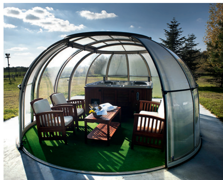
Całoroczna jacuzzi – kapsuła. Doskonałe miejsce do odpoczynku i regeneracji sił.

Mazurskie Siedlisko Kruklin wraz z bazą hotelową funkcjonuje od lipca 2011 roku, a już może się poszczycić doskonałą opinią wśród gości, którzy przyjeżdżają tu m.in. z Niemiec, Włoch, Rosji, Finlandii. Tym, co ich tu przyciąga jest przede wszystkim spokój. To wymarzone miejsce to tego, by się wyciszyć i nabrać sił. Mazurskie Siedlisko Kruklin to elegancki i komfortowy obiekt, w którym człowiek obcuje z naturą w przyjaznych warunkach.